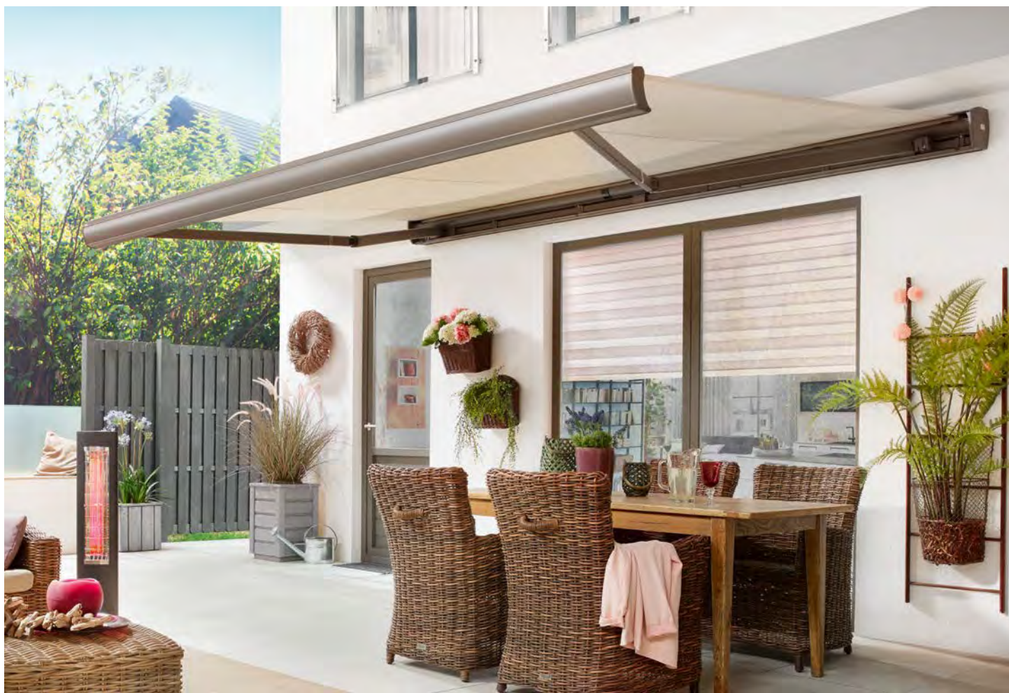
Kompaktes Design mit hohem Komfort und hervorragender Technik.

Klassisches Design, überlegene Qualität, einfache Bedienbarkeit und solide Wertbeständigkeit: Die Family Compact vereint die Schutzfunktion einer Kassettenmarkise mit dem Montagekomfort einer Tragrohr-Markise.