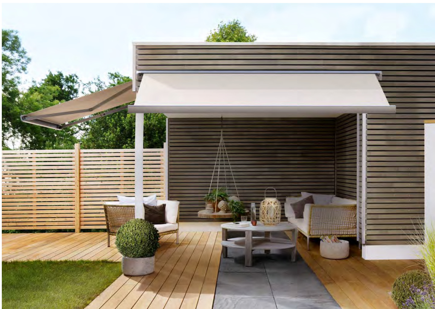
Die Trentino Mini schafft auf kleinen Terrassen behagliche Sitzplätze und setzt farbige Akzente.

Das eckige Design der Trentino Mini harmoniert besonders gut mit modern-geometrischer Architektur und aktuellen Trends. Wie die großen Modelle der Trentino-Familie bietet die Trentino-Mini einen hohen Komfort- und Qualitätsstandard und kann mit diversen optionalen Extras ausgestattet werden.