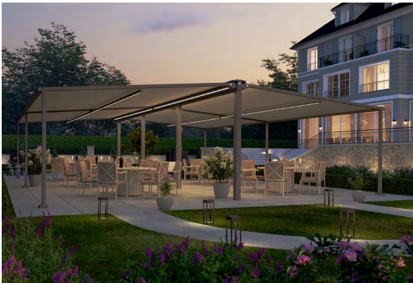
Sonnen- und wettergeschützter Platz für viele Besucher und große Gesellschaften findet sich unter dieser frei stehenden Konstruktion aus einem Doppel-Tragrahmen und vier Portofino-Pergolen.

Der Universal-Tragrahmen von Lewens ist vielseitig einsetzbar: Zur optimalen Nutzung großer Flächen lassen sich Pergolen, Glasdächer und Gelenkarmmarkisen beidseitig als freistehende Konstruktion montieren, um Außenflächen mit maximalem Sonnen- oder Wetterschutz auszustatten. Eine einseitige Verwendung des Universal-Tragrahmens empfiehlt sich bei nicht ausreichend tragfähigen Wänden oder Randsituationen ohne Wand.